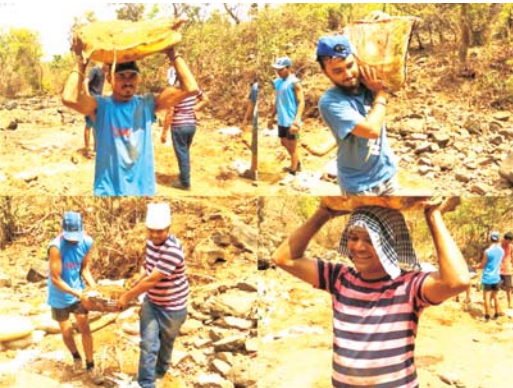
स्थळ- टाकीपठार येथील ओहळ

वनराई बंधारा बांधण्यात वापरण्यात आलेल्या मातीने भरलेल्या पिशव्या योग्य उंच ठिकाणी स्थानांतरित करणे आवश्यक असते. याद्वारे वनराई बंधान्यात वापरलेली माती वाया जात नाही. पावसाळा संपल्यानंतर याच मातीचा पुन्हा वापर केला जातो. यामुळे मृदेचे संवर्धन आणि वेळेची बचत होते.